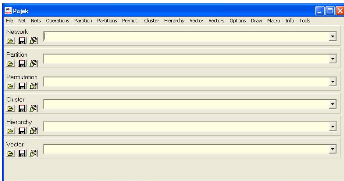
Rysunek 1: Główne okienko programu Pajek.